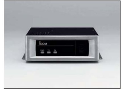
Module canal supplémentaire UR-FR5100 (VHF) ou UR-FR6100 (UHF)