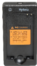
Chargeur rapide (pour batterie Li-ion) CH10L20