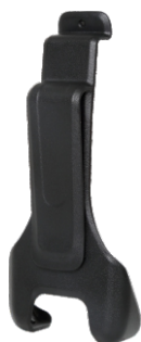
Clip ceinture pour PD35X