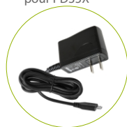
Adaptateur micro USB (5 V/1 A)