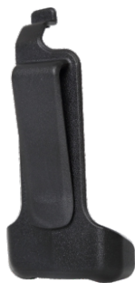
Clip ceinture pour PD36X