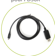
Câble de programmation PC69